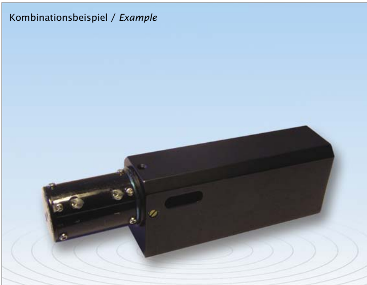
Kombinationsbeispiel / Example