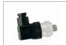
Druckschalter Pressure switches