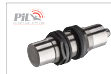
Ultraschallsensoren Ultrasonic sensors www.pil.de