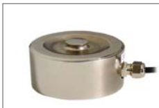
Wägezellen und Kraftsensoren Load cells and force sensors