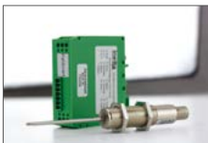
LVDT Weg- und Positionssensoren LVDT displacement and position