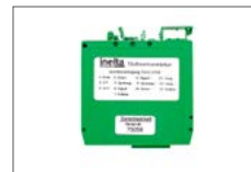
Messwertverstärker Signal conditioner